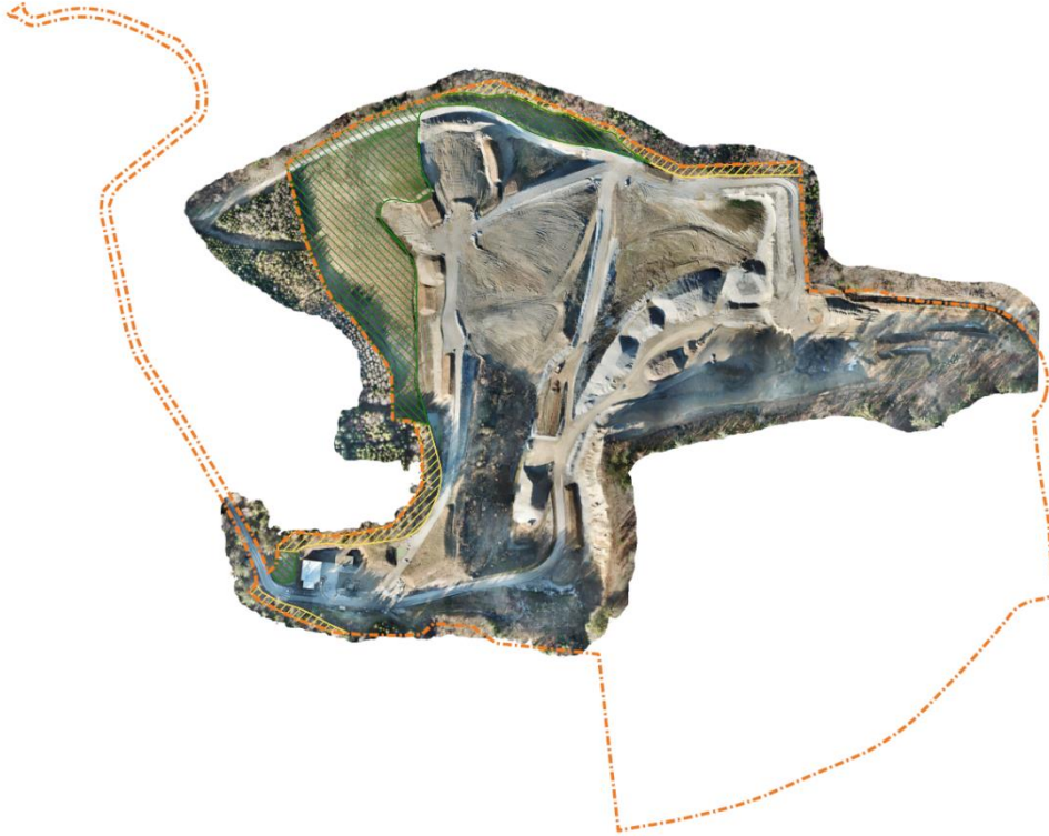
Abbildung 3: Luftbild Stand Februar 2019. orange: Gestaltungsplanperimeter 2019, grün schraffiert: rekultivierte Fläche 2019, gelb schraffiert: keine Rodung