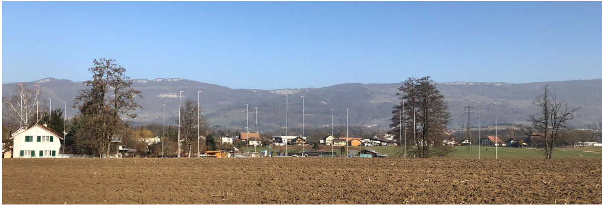
Bauprofil auf dem Gebiet Stöcklimatt in Richtung Jura