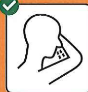
In Taschentuch oder Armbeuge husten und niesen.