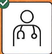
Bei Symptomen sofort testen lassen und zu- hause bleiben.