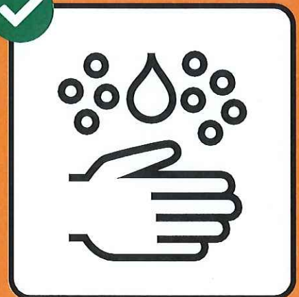
Gründlich Hände waschen.