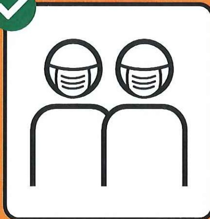
Maske tragen, wenn Abstand- halten nicht möglich ist.