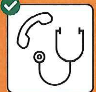
Nur nach telefonischer Anmeldung in Arztpraxis oder Notfallstation.