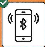
Um Infektions- ketten zu stoppen: SwissCovid App downloaden und aktivieren.