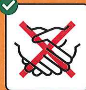
Hände schütteln vermeiden.