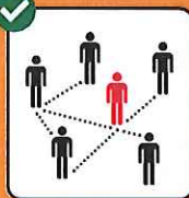
Zur Rückverfol- gung immer vollständige Kontaktdaten angeben.