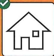
Bei positivem Test: Isolation. Bei Kon- takt mit positiv getesteter Person: Quarantäne.