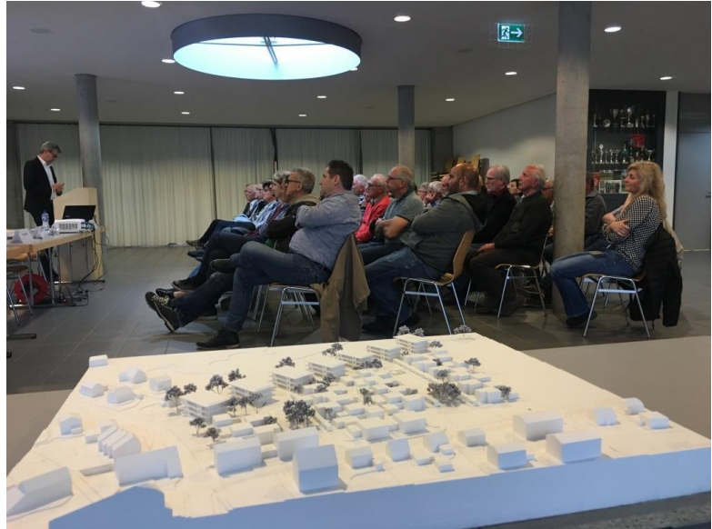
Informationsveranstaltung vom 28.05.2019

Am 28. Mai 2019 konnte sich die Bevölkerung von Deitingen anlässlich einer öffentlichen Informationsveranstaltung über das Siegerprojekt des Studienauftrags orientieren lassen. Die Referenten (Präsident Jury, Einwohnergemeinde und Bürgergemeinde) zeigten den Weg vom Studienauftrag auf. Das Siegerteam, FLURY und RUDOLF Architekten AG von Solothurn, stellten anschliessend ihre Arbeit vor. Anlässlich des Modells konnten sich die Teilnehmer ein erstes Mal in die neue Stöcklimattüberbauung "hineinfühlen". Die Fragen konnten durch die jeweiligen Referenten fachkundig beantwortet werden.